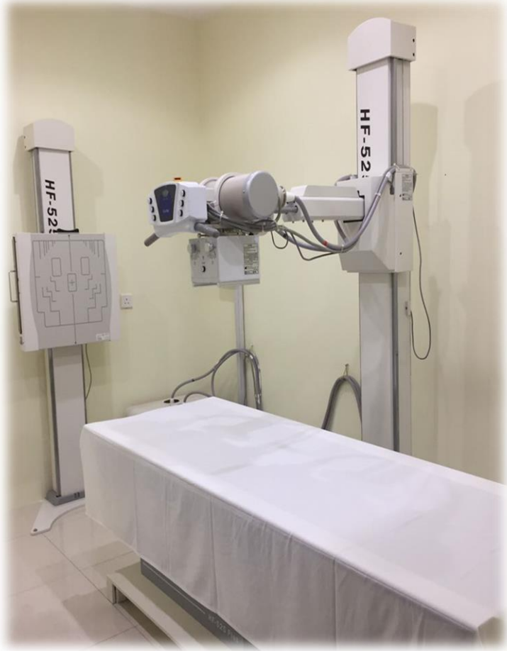
جهاز أشعه سينية