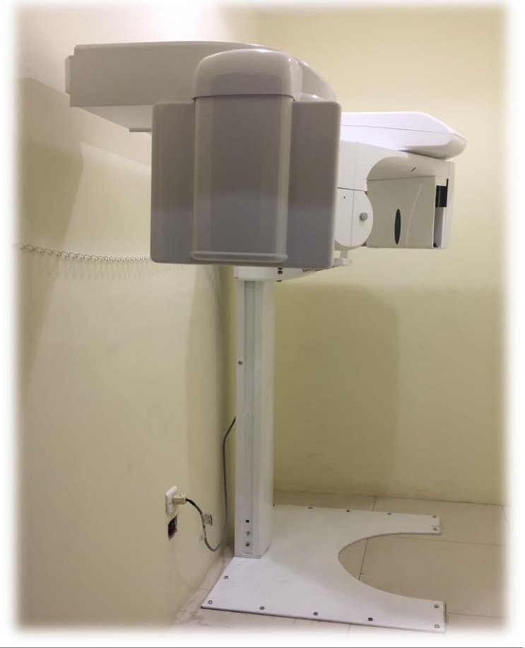
جهاز أشعه بانوراما لعيادات الأسنان