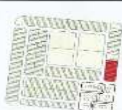
مخطط المزارع ٢

سلطة المدن الصناعية والمناطق الحرة Saudi Industrial Property Authority إدارة المدن الصناعية