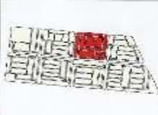
مخطط المنطقة الصناعية الكلية رقم ١٠٤